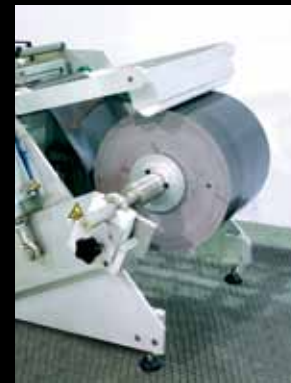
Porta bobina Jumbo Jumbo reel Holder