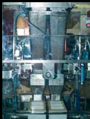
Rifasatori MPD (Multi Point Discharge)