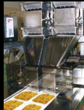
Sistemi di pesatura Dosing unit with automatic weigher