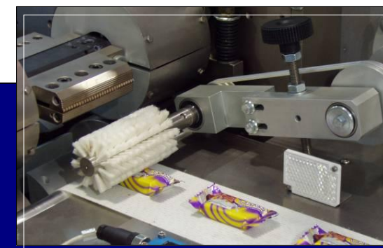
Cepillo rotativo para la extracción de aire