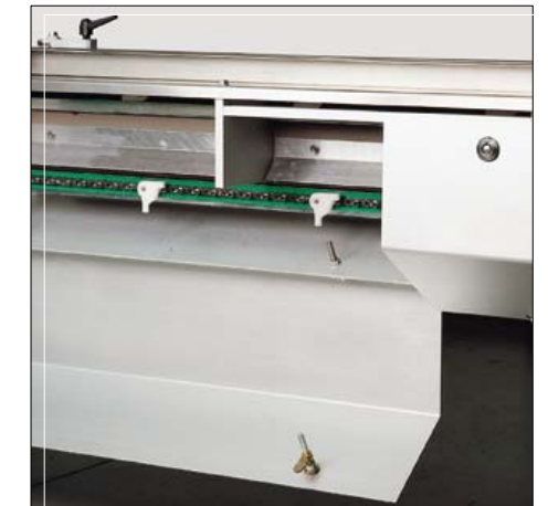
Cinta de alimentación con puertas abatibles Infeed conveyor with side hinged panels Convoyeur d'alimentation avec des portes abattables