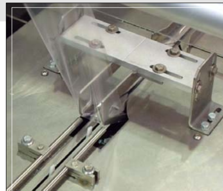
Túnel conformador fijo de alta velocidad