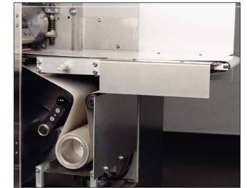
Cinta de salida de desmontaje fácil Easy dismounting outfeed conveyor Convoyeur de sortie à démontage facile