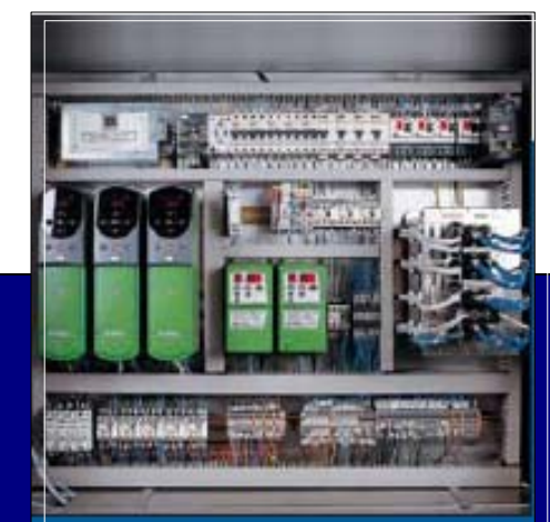
Cuadro eléctrico con control por PC Industrial Electrical Cabinet with Industrial PC Control Panneau électrique avec contrôle par PC industriel