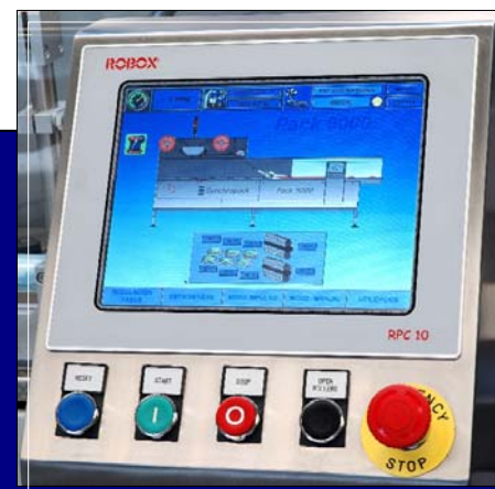
Pantalla táctil / Touch panel / Écran tactile