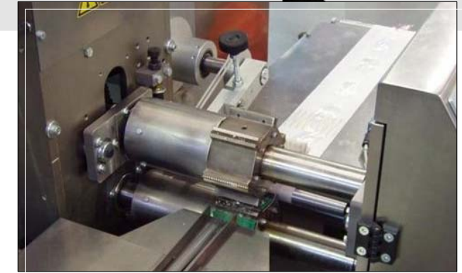
Grupo de soldadura y corte transversal