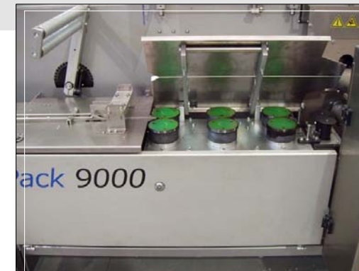
Grupo de soldadura longitudinal