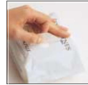
Etiqueta adhesiva Adhesive label

Construcción modular para obtener la máxima flexibilidad de configuración y uso, con motores independientes para cada uno de los movimientos de los grupos que componen la máquina envolvedora. Cuadros eléctricos y controladores independientes para cada módulo, comunicados en red, que permiten una posterior ampliación de la configuración inicialmente escogida.