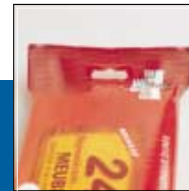
Euroslot para expositor Euroslot for showcase

It is equipped with the Window Pack module, in Soft version (removable label) or in Hard version (resealable label + plastic lid). This module punches a hole in the top of the package that is afterwards covered by an adhesive label, making it easy to open the resulting "window". In this way, it is possible to take out the desired number of wipes and, then, close the window again, maintaining all the characteristics of the products remaining in the package. In order to guarantee the inviolability of the package, there is also an additional label used as a warranty seal, which is broken when the package is first opened, as evidence of use.