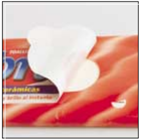
Precinto de garantía Warranty seal