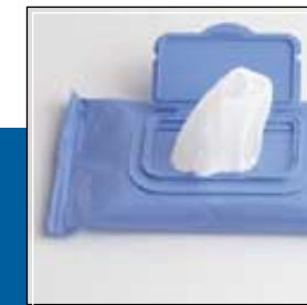
Tapa de plástico Plastic lid